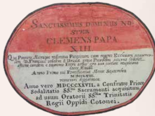
Nota di dono di Papa Clemente XIII. Nota di acquisto per l'Oratorio della Santissima Trinità di Codogno

Accanto ai libri, inventari di donazione e antichi cataloghi della Biblioteca del Seminario attestano l'ingresso dei volumi nella raccolta libraria custodita da questa istituzione, che da secoli gioca un ruolo di profondo significato per la vita della comunità sociale e religiosa lodigiana.